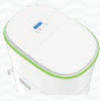
LUCY versie met eenvoudige informatieve display zonder zoutalarm

DE LUCY IS STANDAARD UITGEVOERD MET EEN BY-PASS.