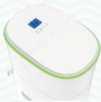
LUCY+ versie met kleurenscherm, ontsmetting module en zoutalarm

Met een LUCY heeft u een moderne waterontharder voor 100% zacht water.